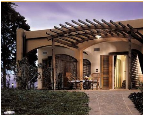
Le Isole: il patio