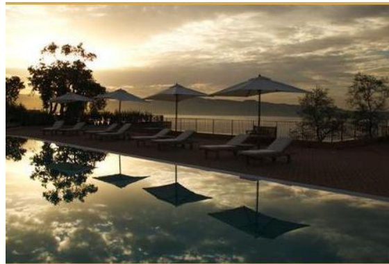
Piscina in riva allo Stretto