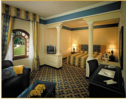
Dormire nel Castello del mito a due passi dal mare: Junior Suite